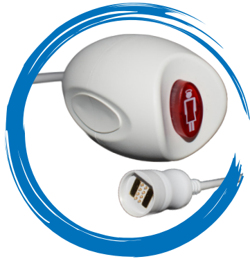
Birntaster mit Magnetkontakt