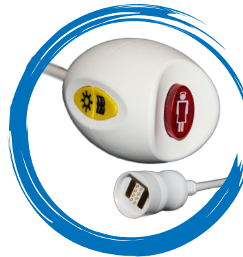
Birntaster mit Lese- und Zimmerlichtfunktion (Magnetkontakt)